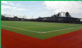
七ヶ浜スタジアム